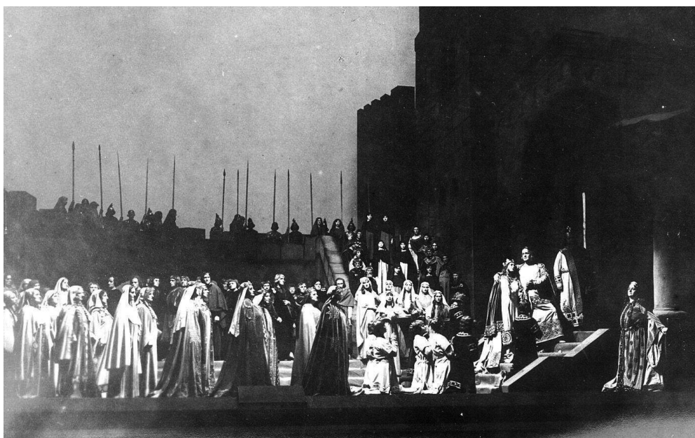
Cenário do 2º ato de Lohengrin , de Richard Wagner, na remontagem apresentada pela Ópera Estatal de Dresden em 1º de setembro de 1929.

Uma música que nasce pouco a pouco, quase sem peso, e vai se espalhando por toda a orquestra até um auge que resplandece e se desfaz, antecipando o drama de confiança e incerteza retratado na ópera. A protagonista Elsa, injustamente acusada de ter matado seu próprio irmão, invoca em sua defesa um cavaleiro misterioso, Lohengrin, que a salva sob a condição de ela nunca perguntar seu nome. Sem narrar ações ou caracterizar personagens, o Prelúdio retrata o amor ideal como algo frágil, permeado de fé e desconfiança, o que transforma a orquestra em elemento narrativo, pensando e preparando a cena antes de qualquer palavra.